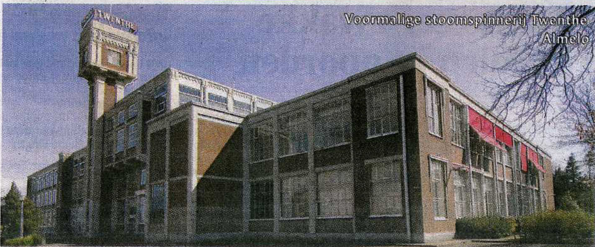
Voormalige stoomspinnerij Twenthe Almelo