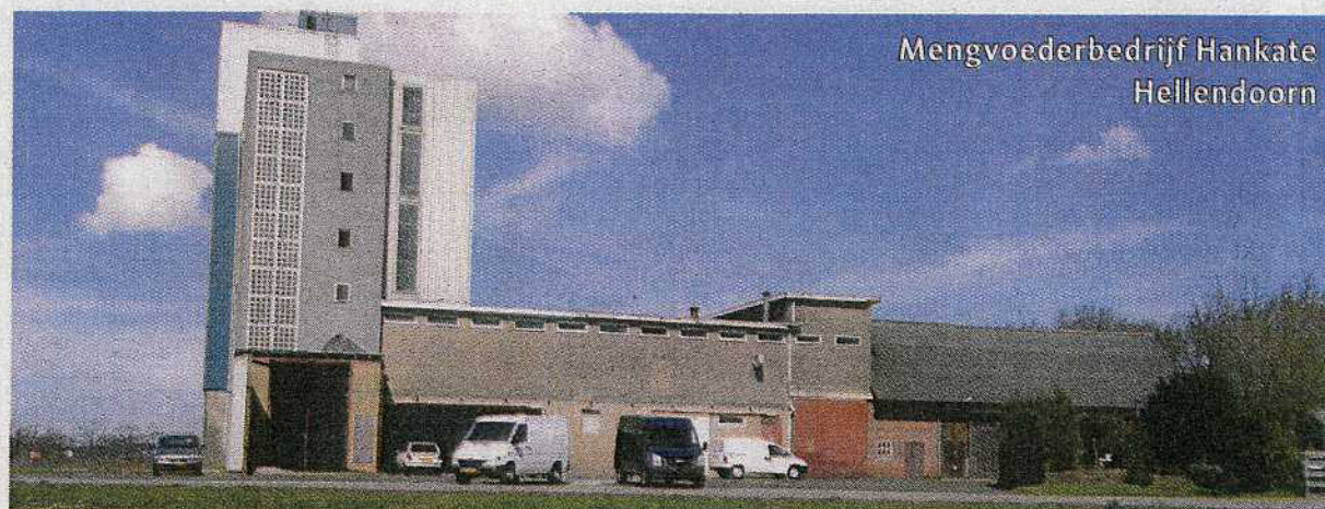
Mengvoederbedrijf Hankate Hellendoorn