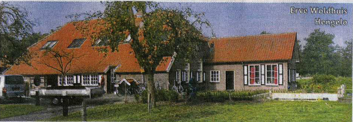
Erve Woldhuis Hengelo